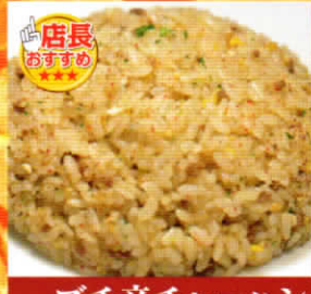
プチ辛チャーハン 辛口850円 大辛900円