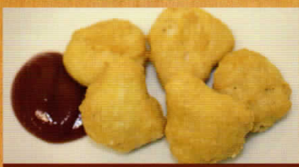
チキンナゲット 250円