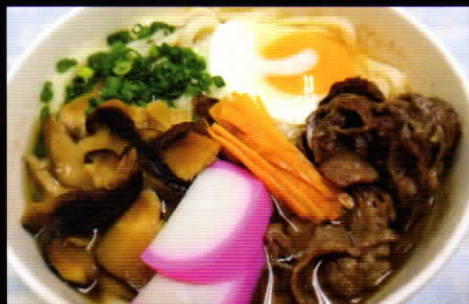
和牛鍋焼うどん 1,380円