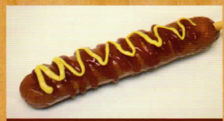
フランクフルト 280円