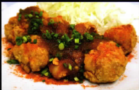
ピリ辛おろし唐揚げ(8個入) 980円