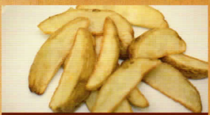
フライドポテト 250円